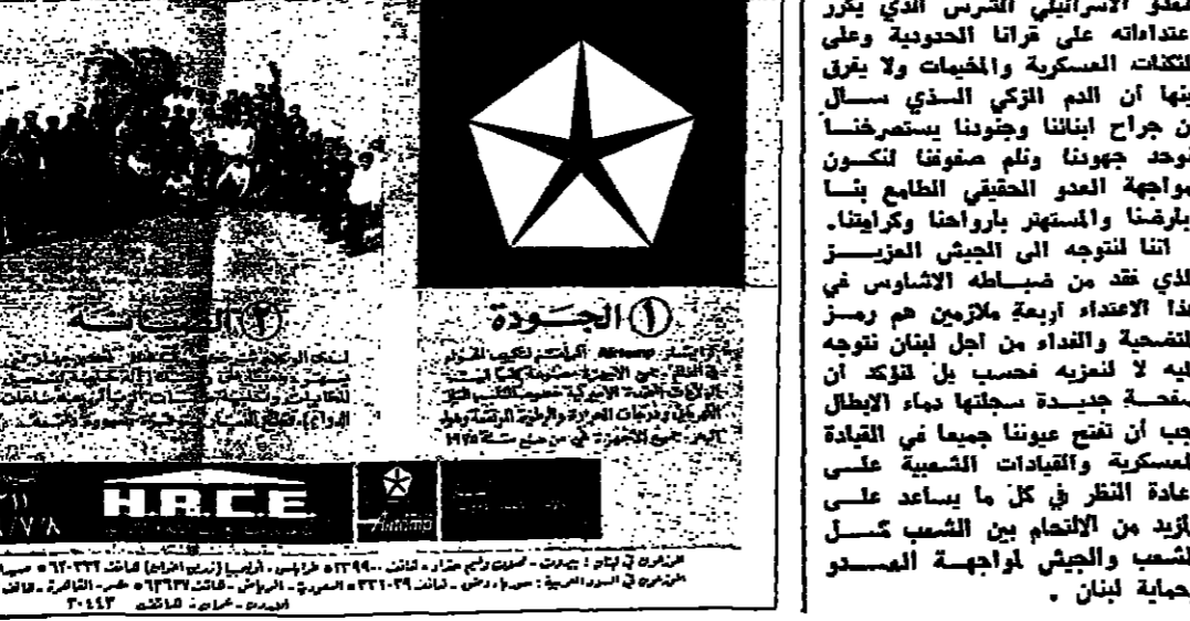
الأولاد في لبنان